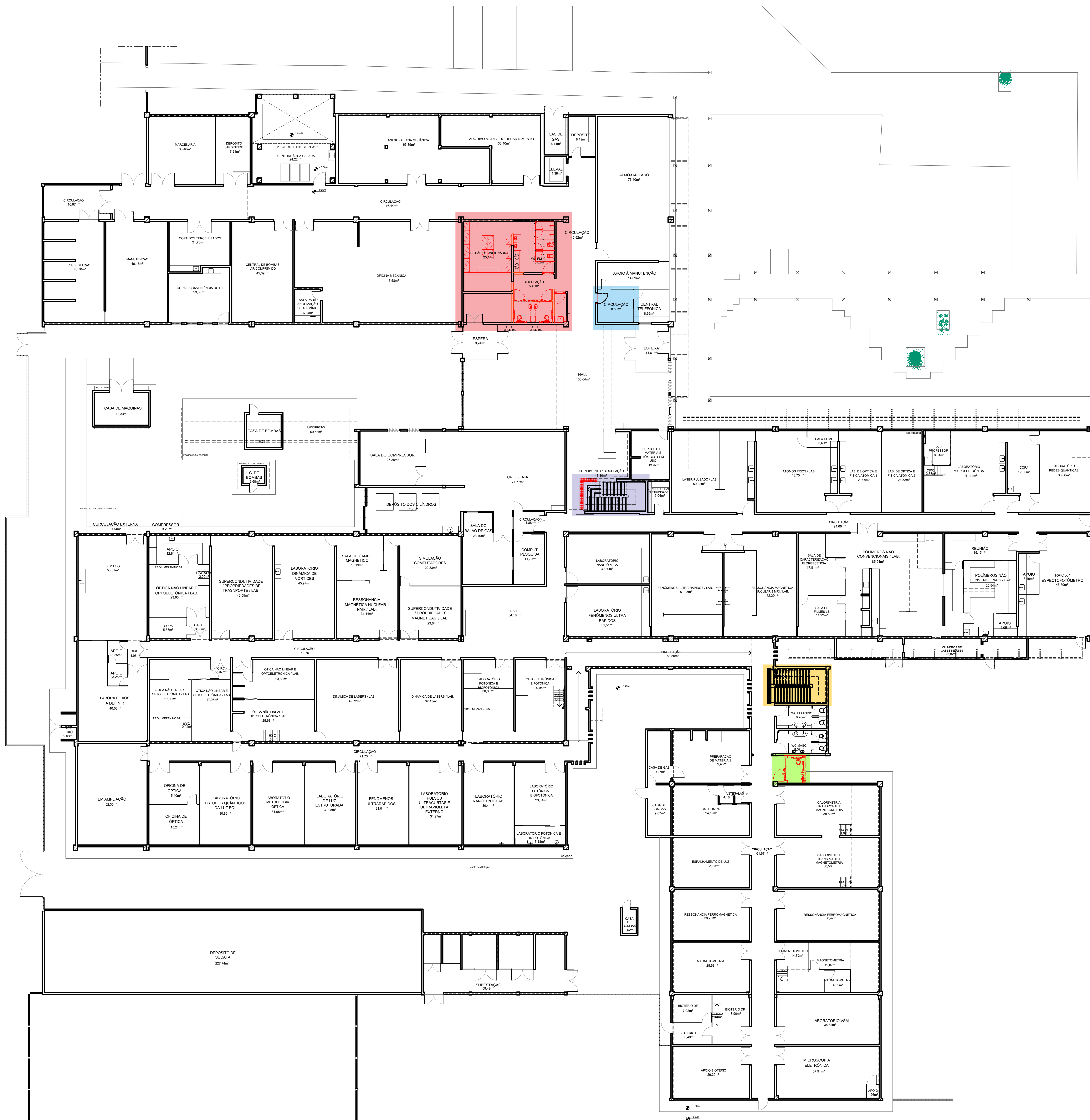
2 PLANTA BAIXA - DPTO. DE FÍSICA - TÉRREO ESCALA: 1/125